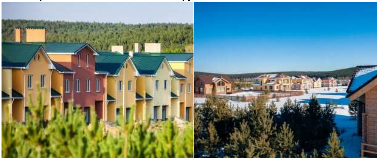
КП "Николин ключ".