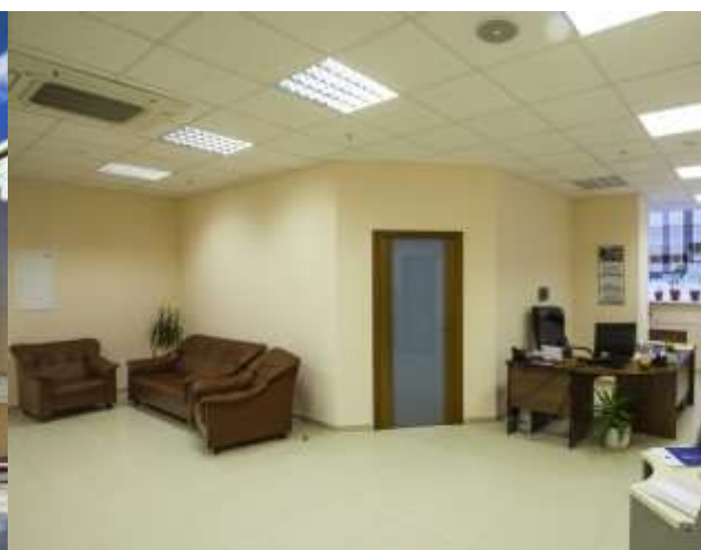
Офис в БЦ "Манхэттен".

*Подробности акции в офисе продаж. Количество объектов, участвующих в акции, ограничено.