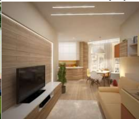
Квартира в ЖК "МонтеКристо", дизайнер Наталья Ермакова.